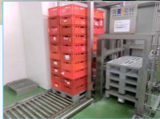
Die Vollautomatische Palettierung mit Palettenmagazin von Reich ist mit ihrem geringen Platzbedarf die ideale Ergänzung für die innerbetriebliche Palettenlogistik.